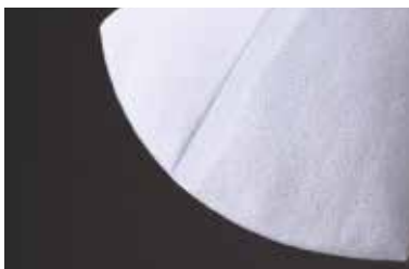
抜け漏れが少なく、精度が安定している熱溶着構造