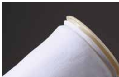
互換性が高く、確実なシールが得られるプラスチック成型カラーリング