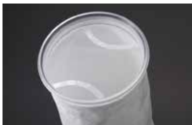
つかみやすい取っ手が、すばやい交換と確実なハンドリングをサポート