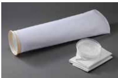
折りたたむのでかさ張らず、廃棄容量を低減